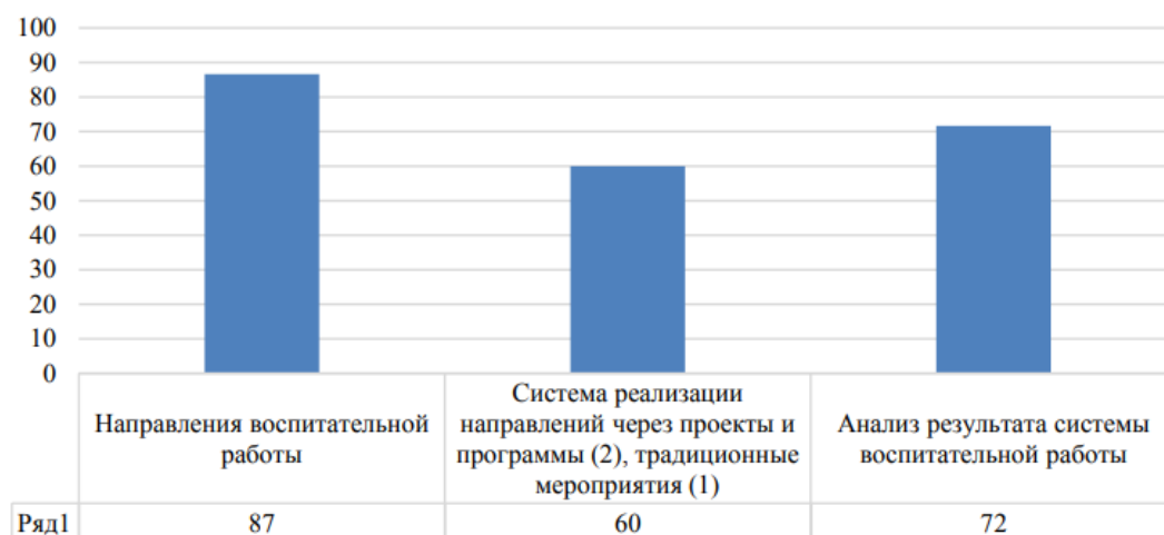
Рисунок 3 – Воспитательная работа в образовательных организациях

Направления воспитательной работы остались без изменений по сравнению с 2021 г., в т.ч. для обучающихся с инвалидностью и рассмотрены в 87% отчетов, но проекты и программы, направленные на реализацию этих направлений, присутствуют только у 62% ОО. Анализ результатов системы воспитательной работы в разной степени основательности рассмотрели 72% вузов-партнёров (Рисунок 3).