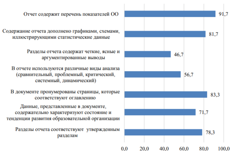
Рисунок 2 – Соотношение соответствия требований к структуре отчёта о самообследованию

Для придания аналитического характера отчётам вузам-партнёрам необходимо включить в отчеты по результатам самообследования анализ показателей по результатам и качеству образовательной деятельности в динамике за три-пять лет; придерживаться критической интерпретации данных, выявляя проблемы и комплексно анализируя пути их решения (кадры, образовательный, воспитательный процессы); использовать пояснения данных таблиц и диаграмм, прописывать выводами подразделов и разделов (Рисунок 2).